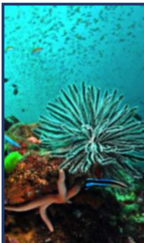
PARADIS: En eventyrlig verden åpner seg under overflaten av Andamanhavet.