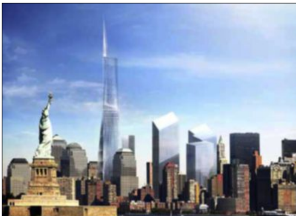
UFERDIG: Den nye skyskraperen i World Trade Center blir USAs høyeste bygning når den står ferdig i 2013. Bygget er allerede blitt et landemerke i New York.

Minnelunden åpnet 11. september i fjor, nøyaktig 10 år etter terrorangrepene. Det er gratis inngang, men man må ha et besøkplass for å komme inn. Dette kan enten hentes ved det offisielle besøks-senteret like ved min-