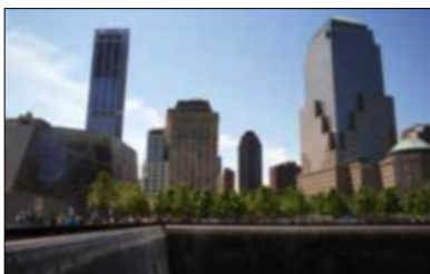
FOTAVTRYKK: To enorme basseng er anlagt i fotavtrykkene til de opprinnelige tvillingtårnene. Navnene på alle som mistet livet under terrorangrepene i 1993 og 2001 er meislet inn i bronsekanten, som omkranser de to bassengene. Til venstre står 9/11-museet, som er tegnet av det norske arkitektfirmaet Snøhetta.